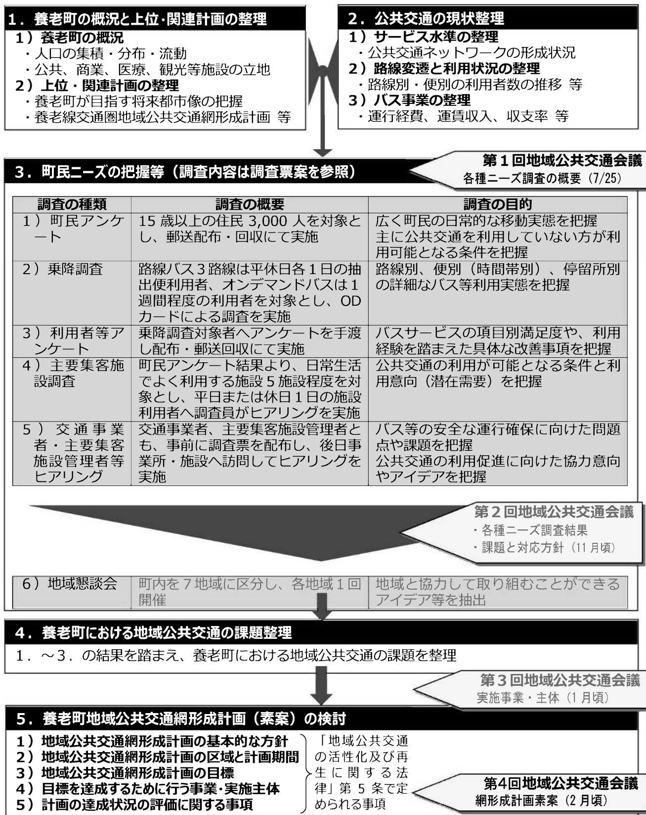
図 養老町地域公共交通網形成計画策定に係る検討フロー（平成 30 年度）

養老町地域公共交通網形成計画は、養老町の地域特性や公共交通の現状、さらには各種ニーズ調査の結果を踏まえ、養老町及びその周辺地域における公共交通の課題を整理した上で、養老町が目指す将来像を支える公共交通のあり方を策定していきます。