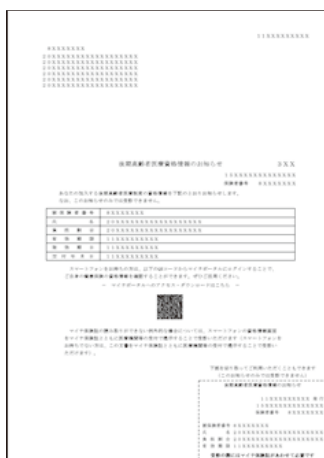
《資格情報のお知らせイメージ》