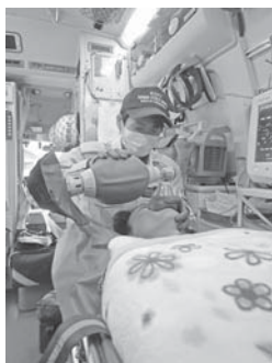
新救急救命士の土地消防士長

約7カ月の研修を終え、新たに救急救命士が誕生しました。複雑多様化する救急現場に対し、研修所で学んだ知識・技術を存分に発揮し、救急救命士を志した初心を忘れず、思いやりを持って活動していきます。