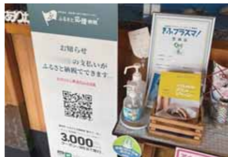
現地決済加盟店の掲示の様子