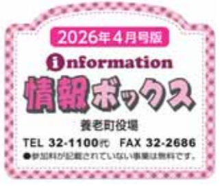
広報養老 情報ボックス

新年度から、会計年度任用職員の勤勉手当支給、常勤に準じた給与改定適及適用、公募三年ルール撤廃など処遇改善が図られた。