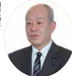
佐野 伸也 議員