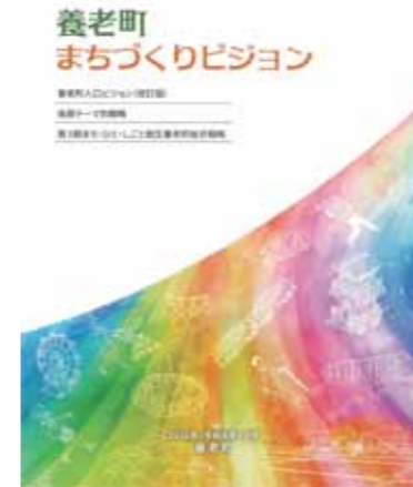
養老町まちづくりビジョン

問 町長一期目の施策に対する進捗状況は。 答 安心して暮らせるまちを維持するために、町民の声に真摯に耳を傾け、誠実に向き合い、真剣に語り合うことで、持続可能なまちづくりへとつなげていきたい。養老の明日を拓くために町政二期目を粉砕自身の覚悟で挑戦する。