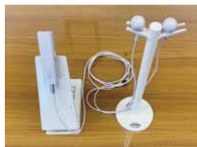
軟骨電動イヤホン