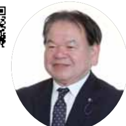
よしだ たろう 議員 吉田 太郎