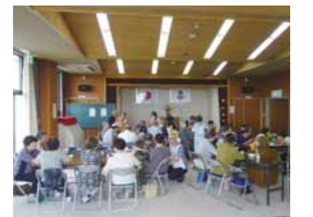
「日吉いきいきサロンあじさい」の様子