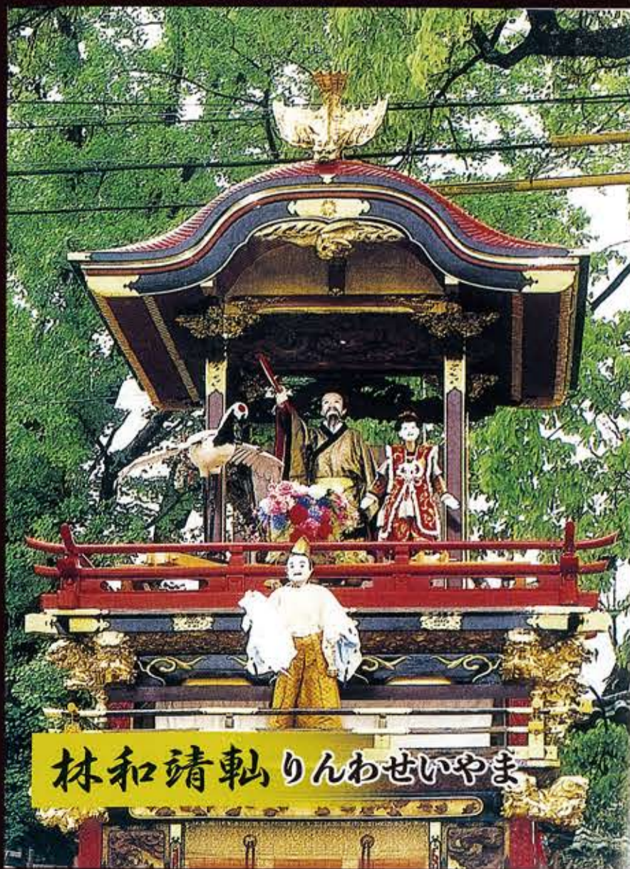
林和靖軸 りんわせいやま