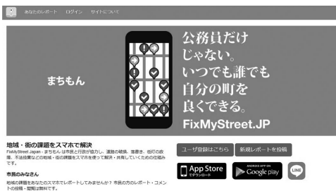
情報共有アプリ「Fix My Street Japan」

問 人口減少やコロナ禍により既存の社会システムが大きく変化しつつある。新技術の導入で既存システムを補完し、社会活動を維持できる。また住民の行政参加による連帯感も生まれる。新しいまちづくり手法の一つとして導入してみたいどうか。