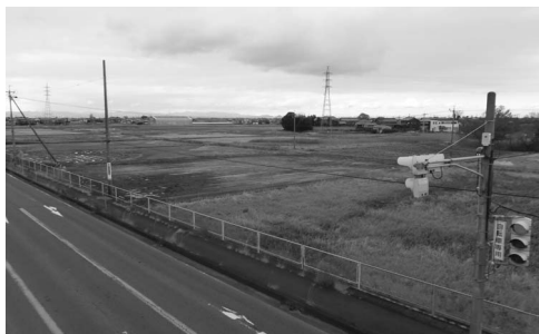
大型商業施設の予定用地（瑞穂地内）