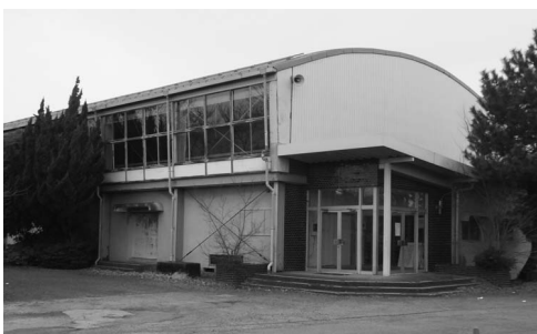
旧池辺町民体育館

問 養老町公共施設等総合計画において方針を出している。個別には所管部署において施設計画を策定し、検討していく。