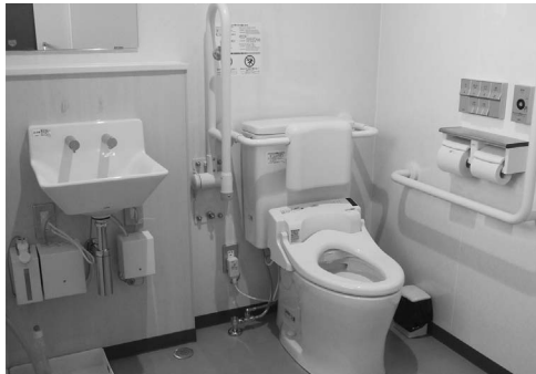
役場本庁舎4階多目的トイレ