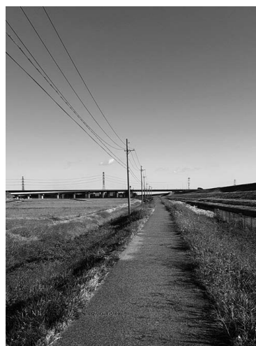
大垣養老高西方面の通学路の様子