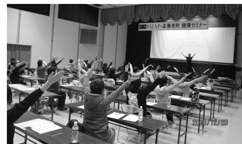
RIZAP 養老町健康セミナー

答 町からの委託事業でスポーツマックス養老を会場に運動教室を開設しており、講座や教室の内容について検討を働きかけていく。