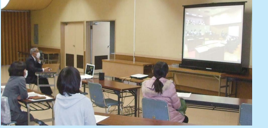
4階大会議室（子ども議会）