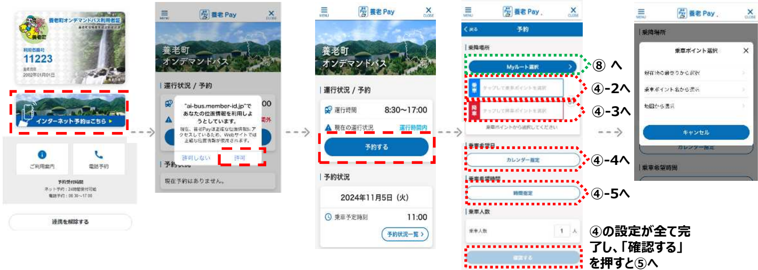
①「インターネット予約はこちら」②「許可」を選択を押す