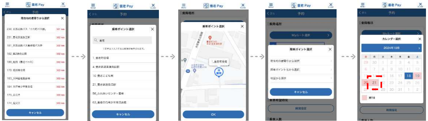
④-2-1「現在地の最寄りから選択」「乗車ポイント名から選択」の候補から選択