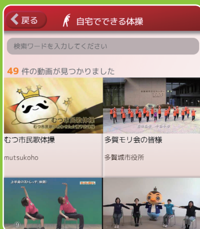
自宅で出来る体操動画 画面イメージ

適切な運動や活動を行うための フローチャートや運動・ 活動メニューを閲覧できます。