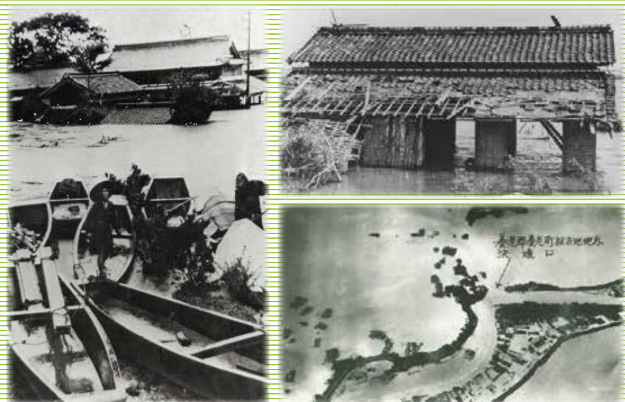
※写真は本養老町河川洪水事務所提供(昭和34年8月及び9月頃)

この地図は、養老町内を流れる主要河川が大雨によって増水し、堤防が決壊した場合の洪水予想結果に基づいて、住民の皆様の避難に役立つように、洪水の範囲とその深さ、ならびに避難場所などを示したものです。